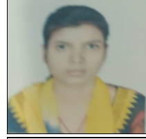
Photo and Signature